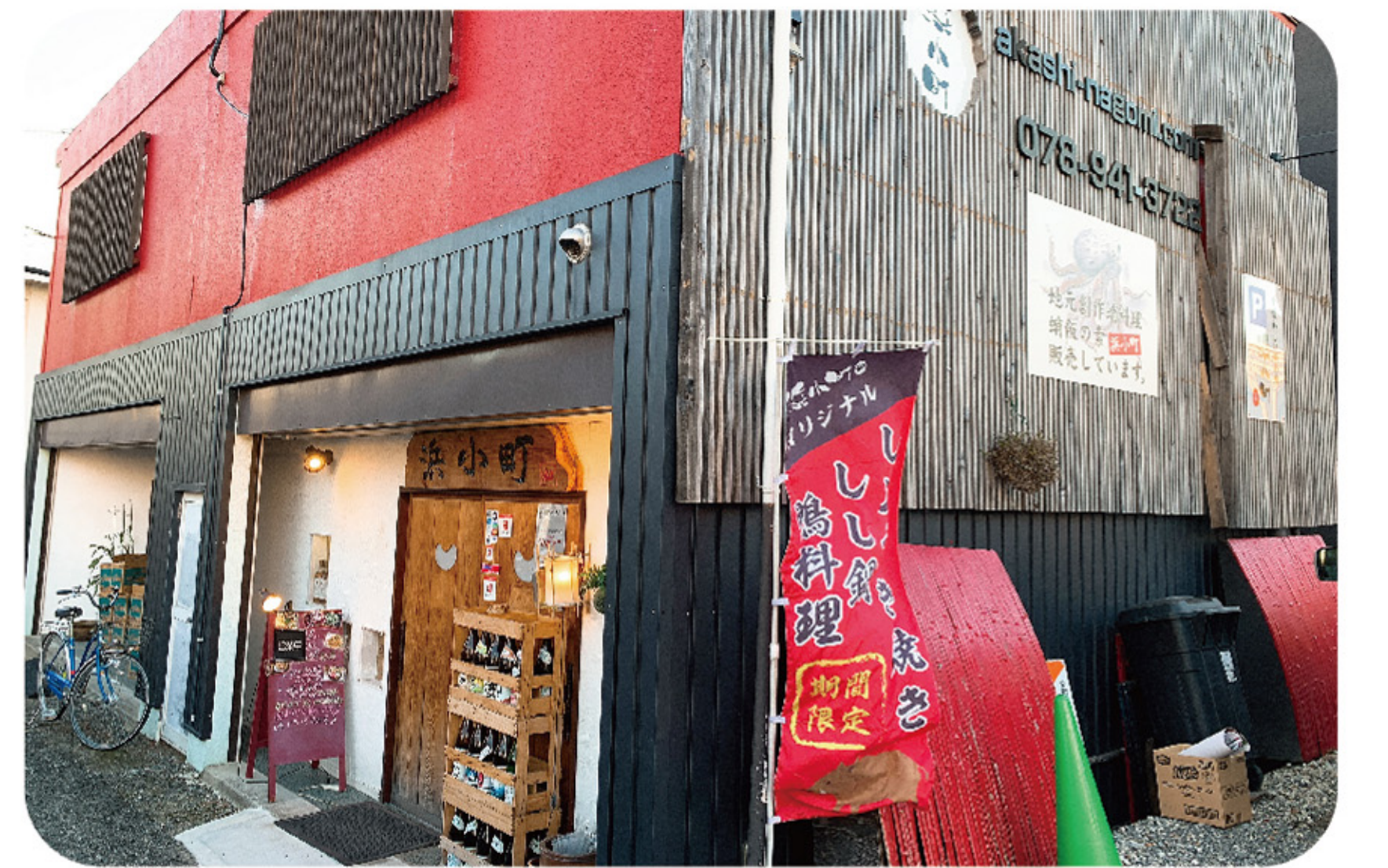
◆ 赤塗りの壁が特徴的な浜小町外観

居酒屋 「東二見浜小町」 障害がある人もない人も お酒好きの人も、そうでない 人も老若男女問わず、ワンコ インで気軽に食べに来られ る「みんなの食堂」のような食 堂をめざし、元気に営業中!!