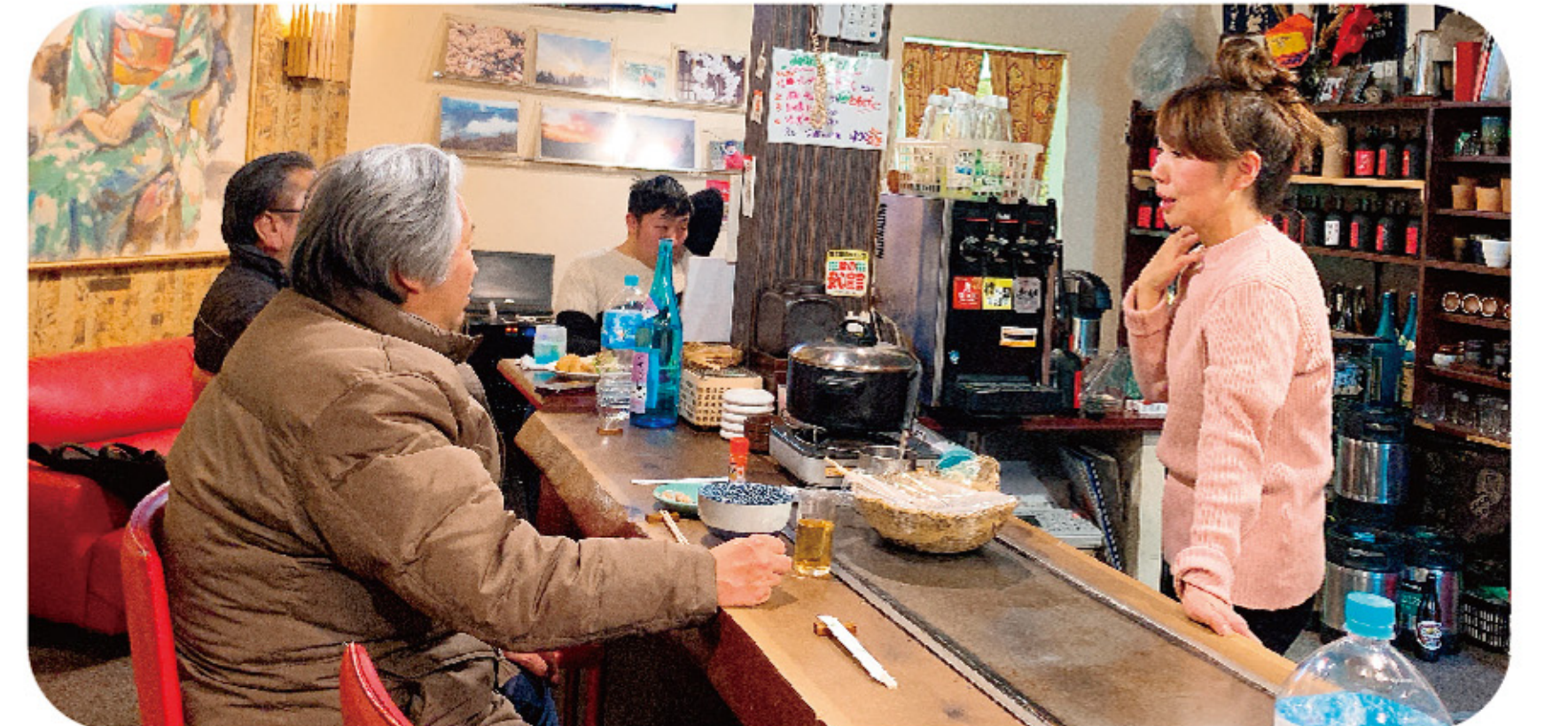
◆ 常連さんが集う浜小町店内