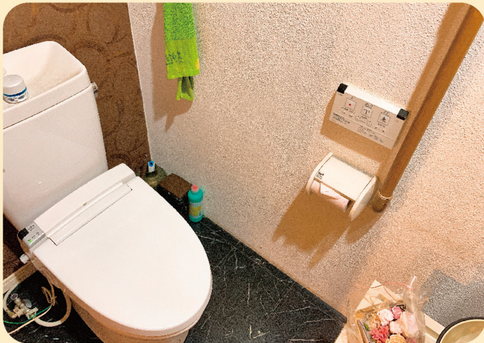
◆ トイレ内に手すりを設置