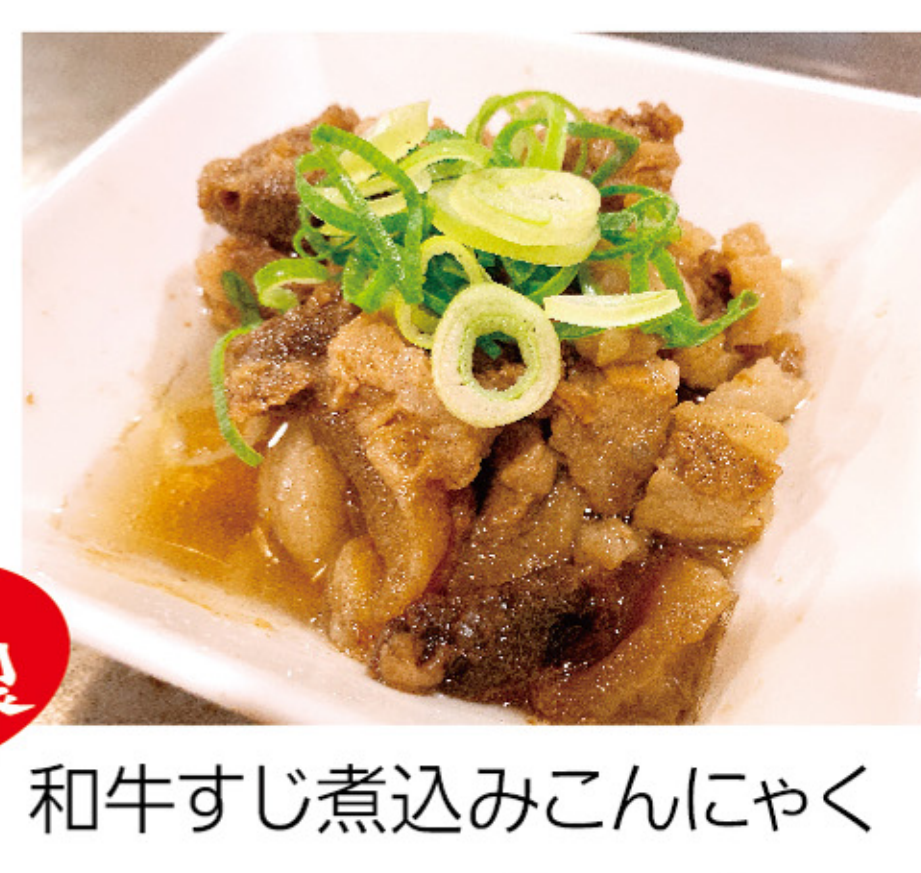
和牛すじ煮込みこんにやく