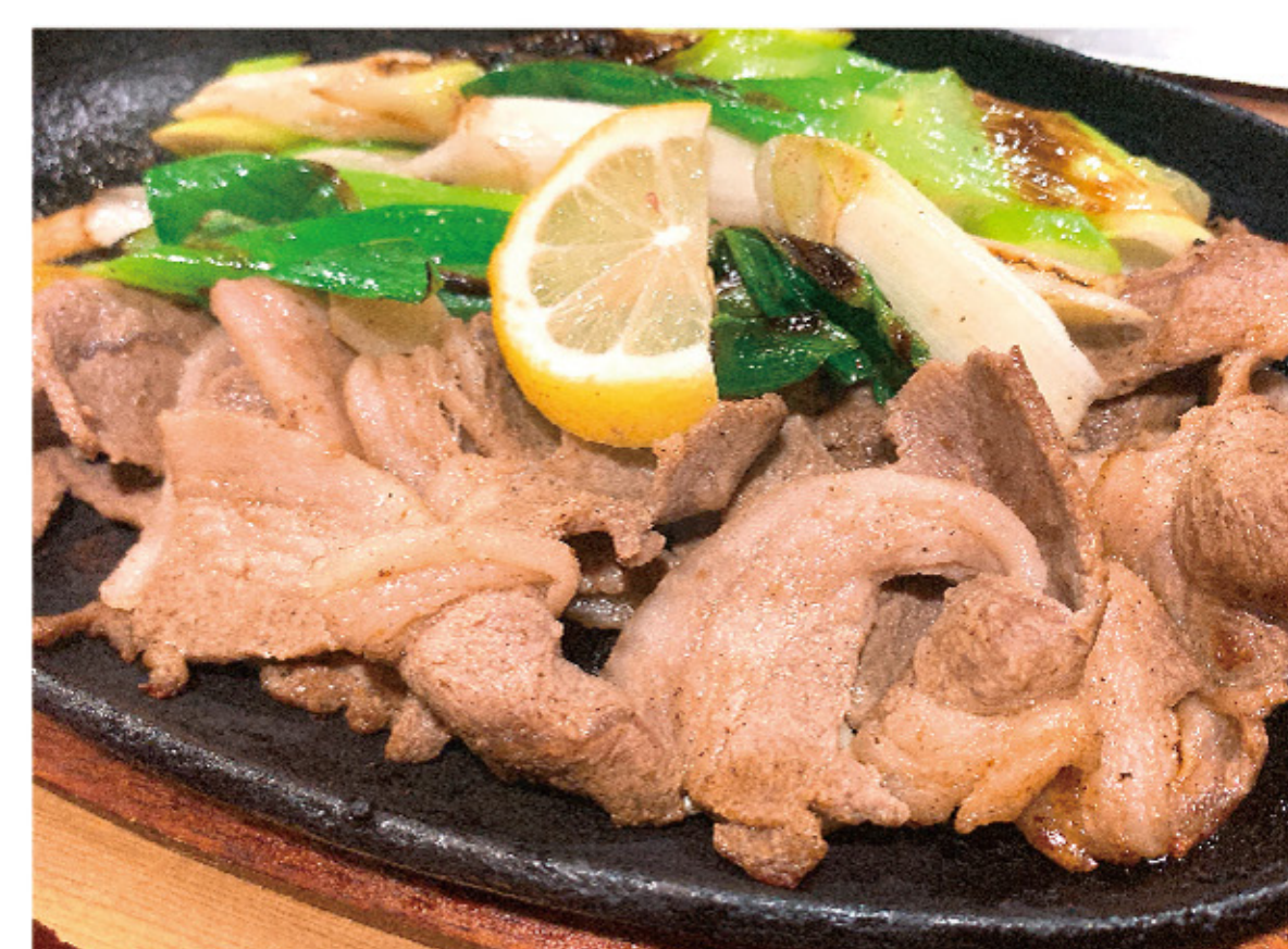
ジビエ鉄板焼き(猪)