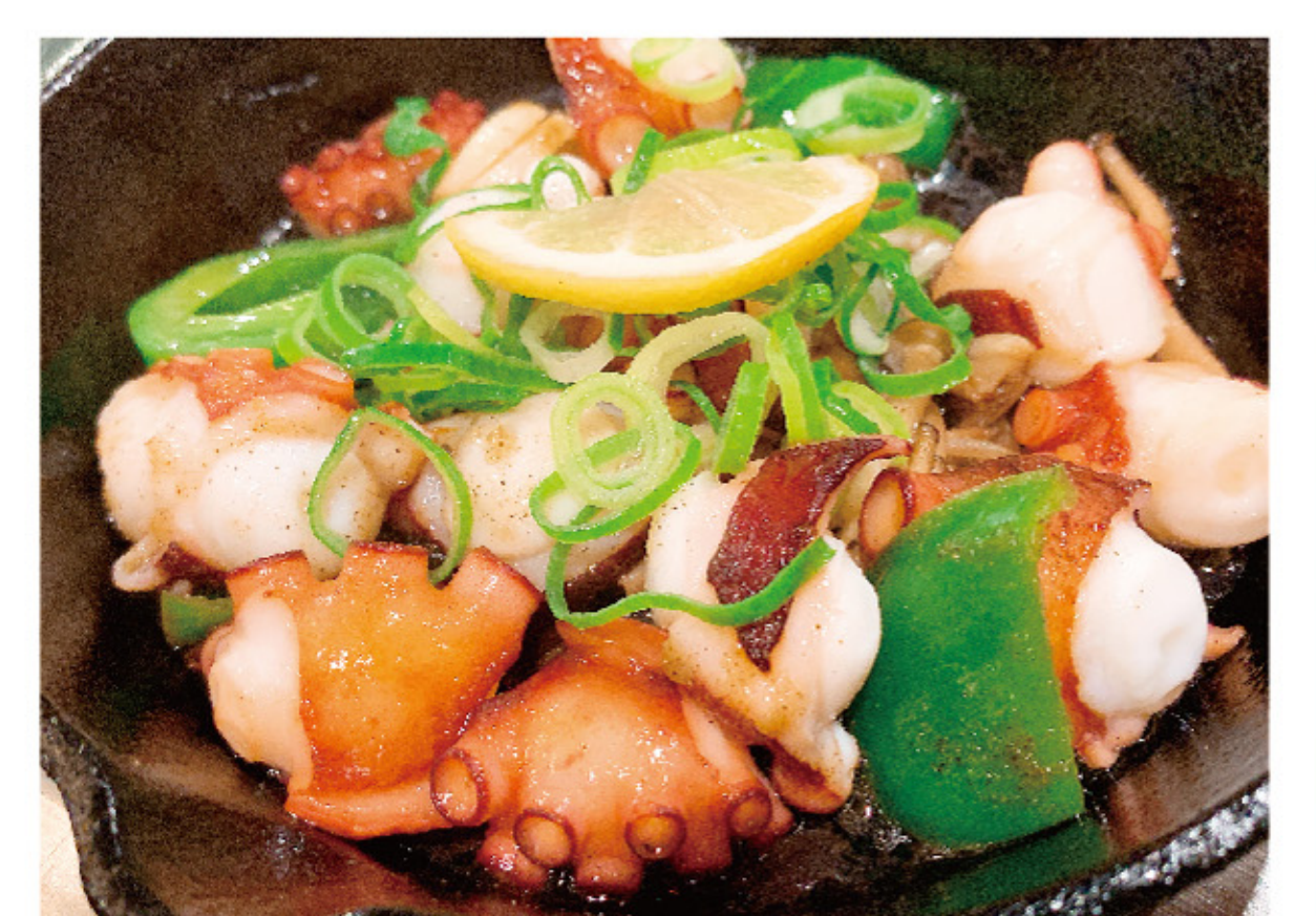
二見のタコのガーリックいため