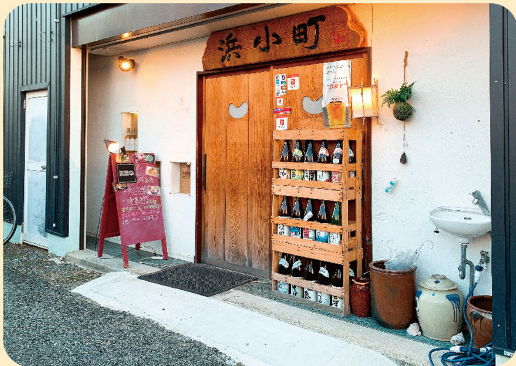
◆ 段差をなくしたバリアフリーな店舗入口