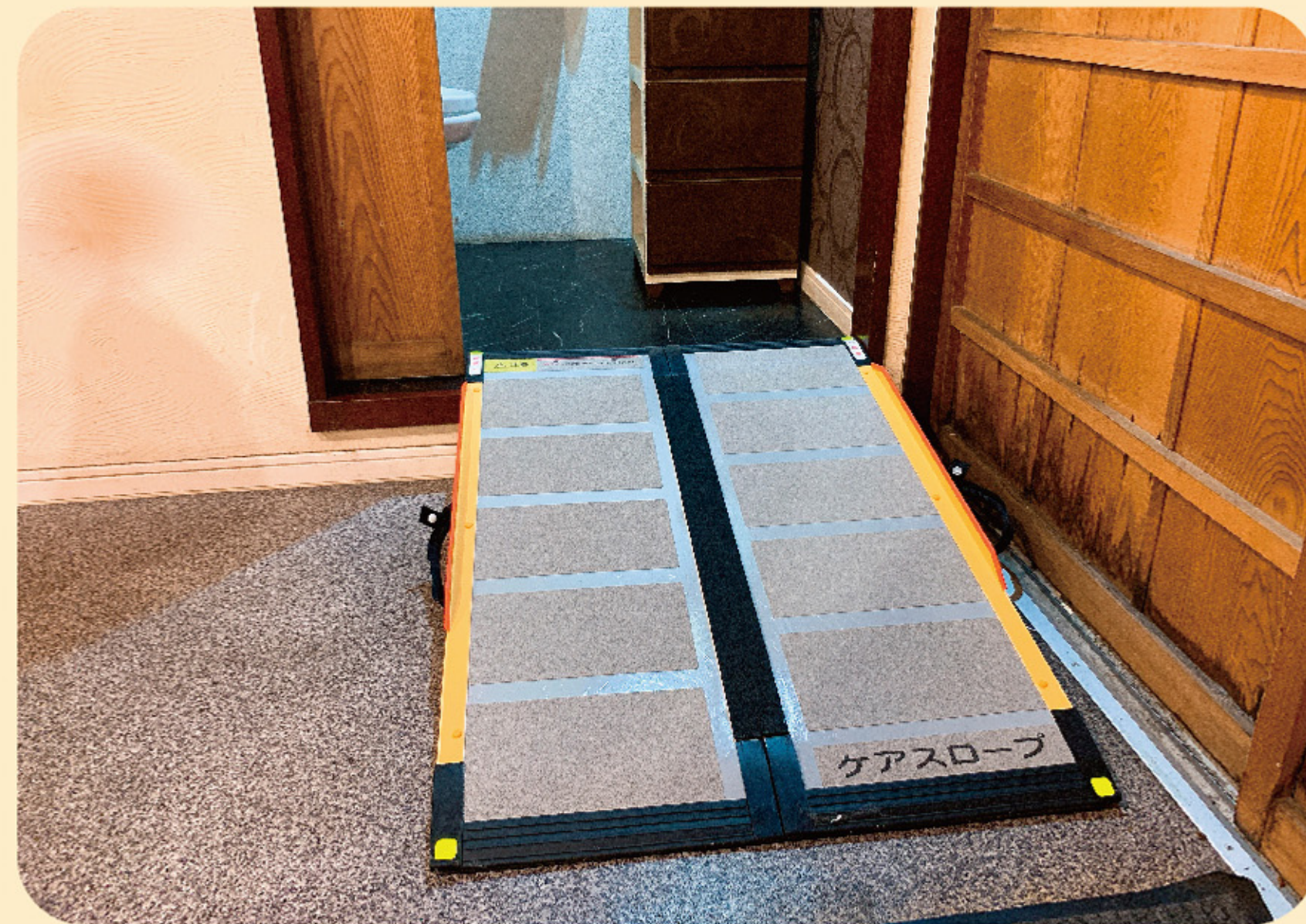
◆ トイレの出入りを簡易スロープでスムーズに

居酒屋 「東二見浜小町」 障害がある人もない人も お酒好きの人も、そうでない 人も老若男女問わず、ワンコ インで気軽に食べに来られ る「みんなの食堂」のような食 堂をめざし、元気に営業中!!