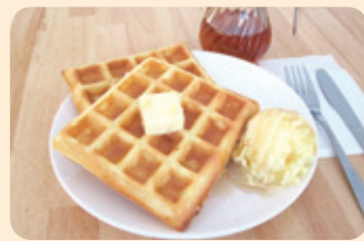
ワッフルセット (パナアイス添え・ドリンク付) ¥600