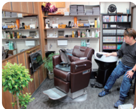
◆利用者様が移動することなく、カットとシャンプーが行えるレイアウトを採用しています。

A 完全予約で、完全個室にしていますので、他のお客様の目を気にすることなく来店できます。待ち時間ゼロを当たり前に行えるよう営業しています。そして、成功体験をすることにより、次回からのステップを考えています。慣れてくると、声かけを極端に少なくしたり、他の理美容室に行っても大丈夫なように接客してみたりもしています。いつか、近くのお店であったり、好みのお店に行くことができるようにすることを目的としています。と言っても、うちも商売ですので、Weathercockを気に入っていただけることが一番ですが... (笑) 引越など、遠くに行くことあって心配がない様になっています。身体障がい者の方もバリアフリー化してありますので、来ていただけます。Weathercockに来店していただければ、どこに行けば良いかという悩みはなくなると思います。というのは言い過ぎですが、そうなるように頑張ります。