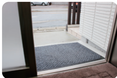
◆店舗入り口には、スロープを設置して、バリアフリー化しています。