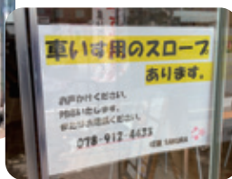
●車イスの方も安心です。