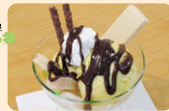
チョコレートサンデー ¥400 和風サンデー ¥400