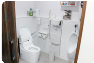
◆車いすごとに入れる車いす対応トイレも完備しています。