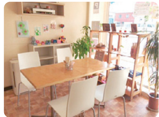
●楽しくふれあえる明るい店内。

PRポイント さくら工房に通所の方がお手伝いや接客をしているお店です。落ち着いた店内で調理師の優しい手料理(日替わりランチやデザート)を提供しています。厳選されたコーヒー豆を使ったコーヒーも評判です。車イスの方もご利用いただけるようスロープも備えています。店内には障がいのある方たちが心をこめて作った手作り小物やクッキーも販売しています。