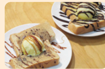
Dセット (チョコソース&パナアイスのトースト・ドリンク付き) Eセット (黒蜜&パナアイスのトースト・ドリンク付き) 各¥500