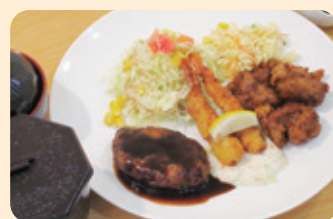
ハンバーグ&エビフライ&鶏の唐揚げセット ¥800