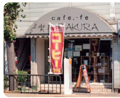
●山陽大蔵谷駅のすぐとなりです!