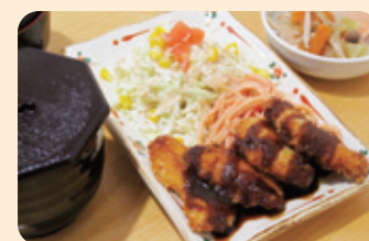
チキンカツセット ¥580