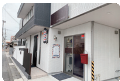
◆駐車場から段差なく店内に入れます。