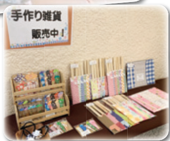
かわいい小物を随時販売しています。