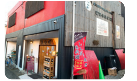
◆赤塗りの壁が特徴的な浜小町外観

「東見浜小町」 居酒屋 障害がある人もない人も お酒好きの人も、そうでない 人も老若男女問わず、ワンコ インで気軽に食べに来られ る「みんな食堂」のような食 堂をめざし、元気に営業中!!