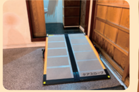
◆トイレの出入りを簡易スロープでスムーズに

「東見浜小町」 居酒屋 障害がある人もない人も お酒好きの人も、そうでない 人も老若男女問わず、ワンコ インで気軽に食べに来られ る「みんな食堂」のような食 堂をめざし、元気に営業中!!