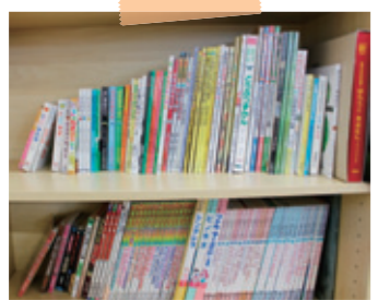
◀子ども図書コーナー

▲ 飲食スペース奥には、液晶テレビをはじめ、 キッズスペースや子ども図書コーナーも あり、お子様連れでの飲食やミーティング にも最適な交流スペースです。