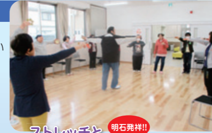
ストレッチと 明石発祥!!