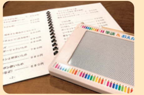
◆点字メニューと筆談ボード