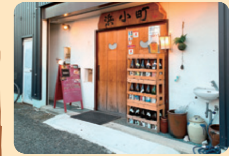
◆段差をなくしたバリアフリーな店舗入口