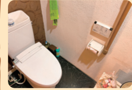
◆トイレ内に手すりを設置