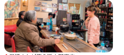
◆常連さんが集う浜小町店内

所在地 〒674-0092 明石市二見町東二見1330-2 TEL 078-941-3722 営業時間 17時～23時 ※ランチタイムは予約のみ 定休日 日曜日・祝日 駐車場 4台あり