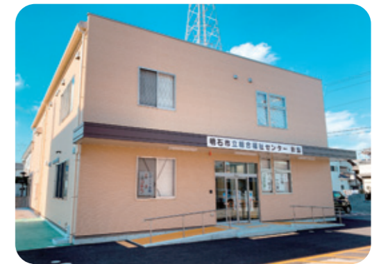
◆明石市立総合福祉センター 新館

新しい交流施設ができました。 令和元年5月13日(月)に新館がオープンしてから、まもなく1年を迎えようとしています。 新館は、障害のある人ない人すべての人が、障害者スポーツを通して同じ空間で交流し、共生社会の実現を目指して建てられました。 地域のお子様や大人の方、事業所の方等、たくさんの方が新館に来てくれています! さてさて、新館が建てられた目的を皆さんご存知ですか? 今日は、まだ新館に来られたことがない方のために、新館の設備やスポーツ教室体験、喫茶交流スペースについてご紹介します。