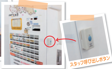
スタッフ呼び出しボタン

券売機で食券をお求めください。 券売機横には、スタッフ呼び出しボタンを設置しています。▲